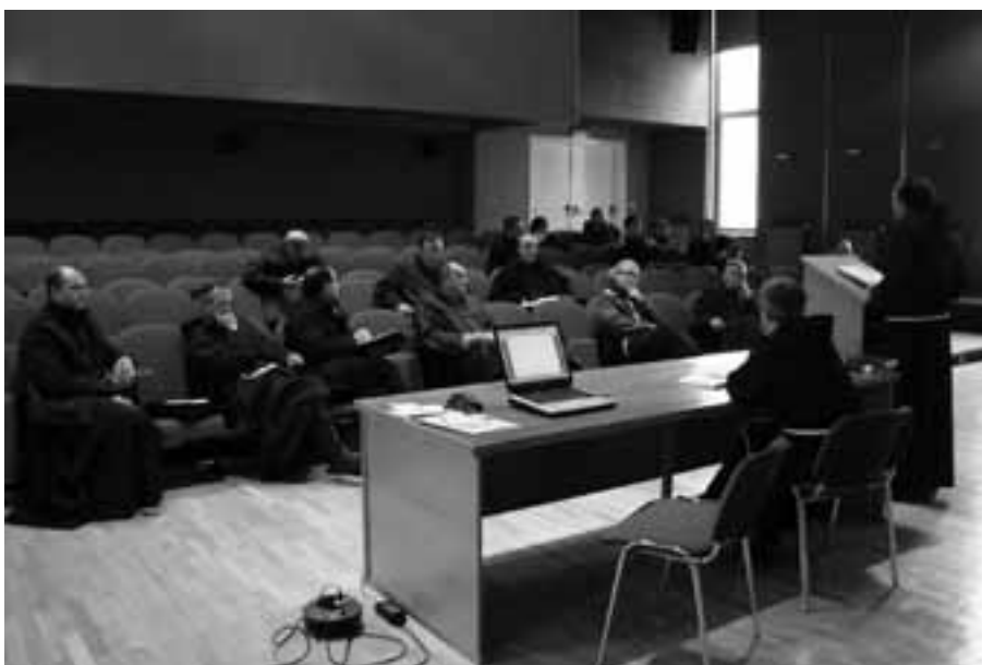
Drugi susret gvardijana i Uprave Provincije