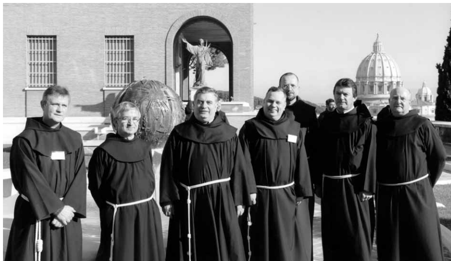
Novi slavenski provincijali sa Generalom Reda (Rim, siječanj 2010.)