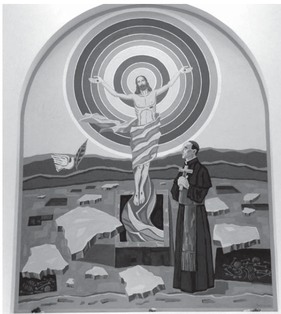
Vlatko Blažanosvić; Oltarska freska crkve u Orašju