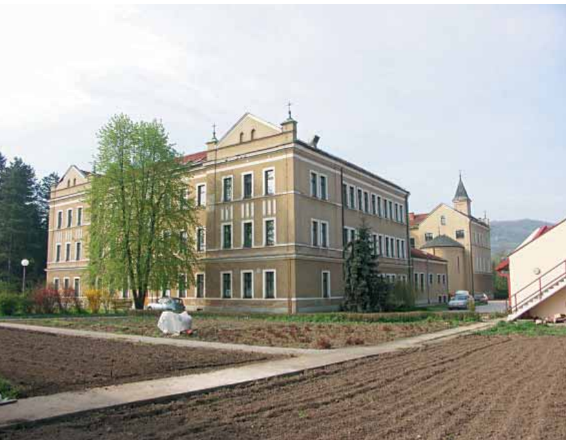
Sjemenište i crkva: pogled iz vrta

Zbog neuvjetnog smještaja škola je koncem sljedeće godine premještena u Guču Goru i ondje je ostala do 1900, kada je preseljena u Visoko. Kroz ovo vrijeme škola je imala svega tri razreda s tridesetak đaka. Troškove održavanja snosili su sami franjevci, jer ondašnja državna vlast nije priznavala niti na bilo koji način pomagala ovu školu.