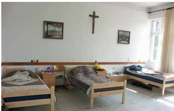
Jedna od spavaonica