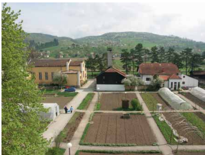
Dom sv. Ante (lijevo) i gospodarske zgrade