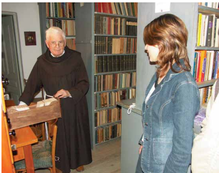
Profesorska knjižnica služi i vanjskim đacima

Osobito su vrijedna različita periodična izdanja s oko dvanaest tisuća svezaka, od kojih posebno treba spomenuti Rad JAZU (HAZU) i Glasnik Zemaljskog muzeja iz Sarajeva.