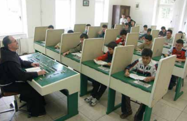
U kabinetu za jezik