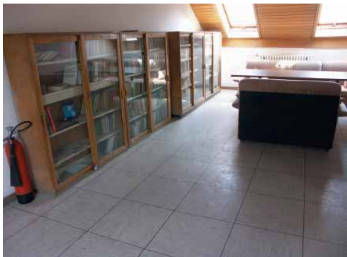
Mala đaćka knjižnica u potkrovlju

U potkrovlju iznad sjemenišnih prostorija uređene su sobe, a na hodnicima u čitavoj zgradi i na zidovima u prizemlju postavljena je mramorna obloga. Kuhinja i obje blagovaonice također su prilagođene novim standardima. U dvorištu je podignuta nova zgrada za pranje i glačanje rublja i uz nju garaže i radionica, a obnovljena je i za kat dograđena sestarska kuća. Jedan od značajnijih građevinskih zahvata u obnovi zgrade Gimnazije i Sjemeništa bila je i izmjena svih prozora 2002. godine.