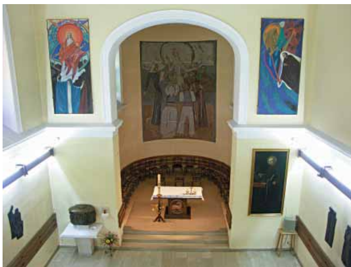
Samostanska crkva sv. Bone (svetište)

koji su se upisivali na državne fakultete. Naime, pravo javnosti ova će škola dobiti tek 1992. U skladu s reformom školstva pedesetih godina prošlog stoljeća, Gimnazija je morala, umjesto osmogodišnjeg, prihvatiti četverogodišnji sustav školovanja. Danas su đacima, uz udobne učionice i standardna školska pomagala, na raspolaganju đачka knjižnica i moderni kabineti informatike i stranih jezika.