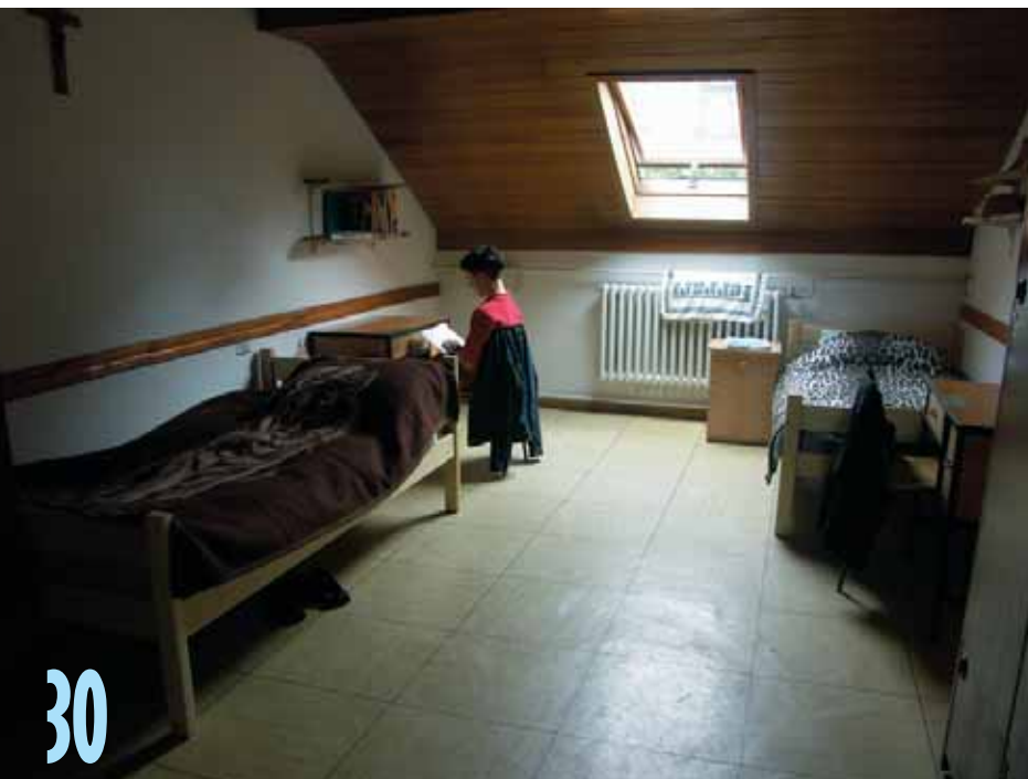
Učenička soba u potkrovlju