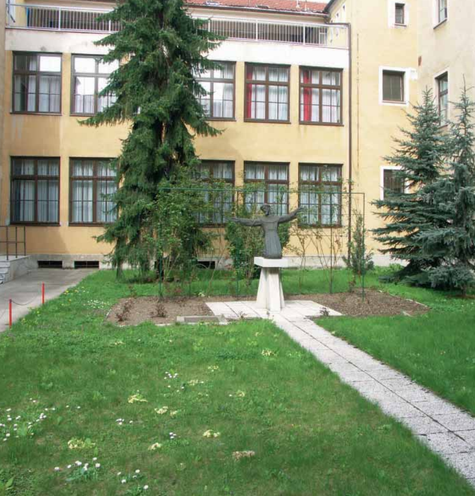
Unutarnje dvorište Sjemeništa