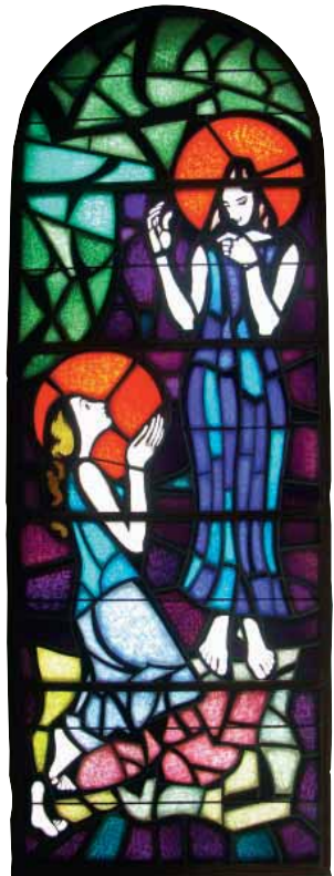
Slavko Šohaj, Navještenje (vitraj u samostanskoj crkvi)