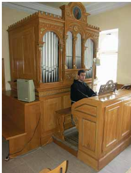
Glazbenom odgoju pridaje se velika pažnja