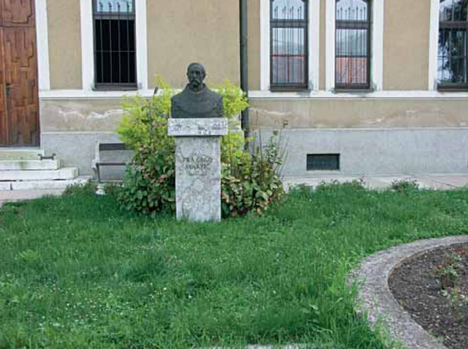
Ivan Meštrović, Fra Grgo Martić