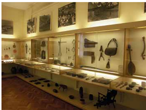
Alatke, oružje i predmeti kovačkog obrta...

Izložci prikazuju svakodnevni život, obradu željeza, odjeću i neke običaje katolika srednje Bosne, osobito vareškog kraja. Tu su u prvom redu alatke i proizvodi kovačkog obrta, potom staro oružje, predmeti iz religiozne prakse, ručno rađeni dijelovi odjeće, nakit i proizvodi od kože izrađeni u Visokom. Uočljiva je i narodna seoska nošnja, muška i ženska, iz Kraljeve Sutjeske.