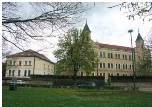
Zgrada Sjemeništa s pročelja i sestarska kuća (lijevo)