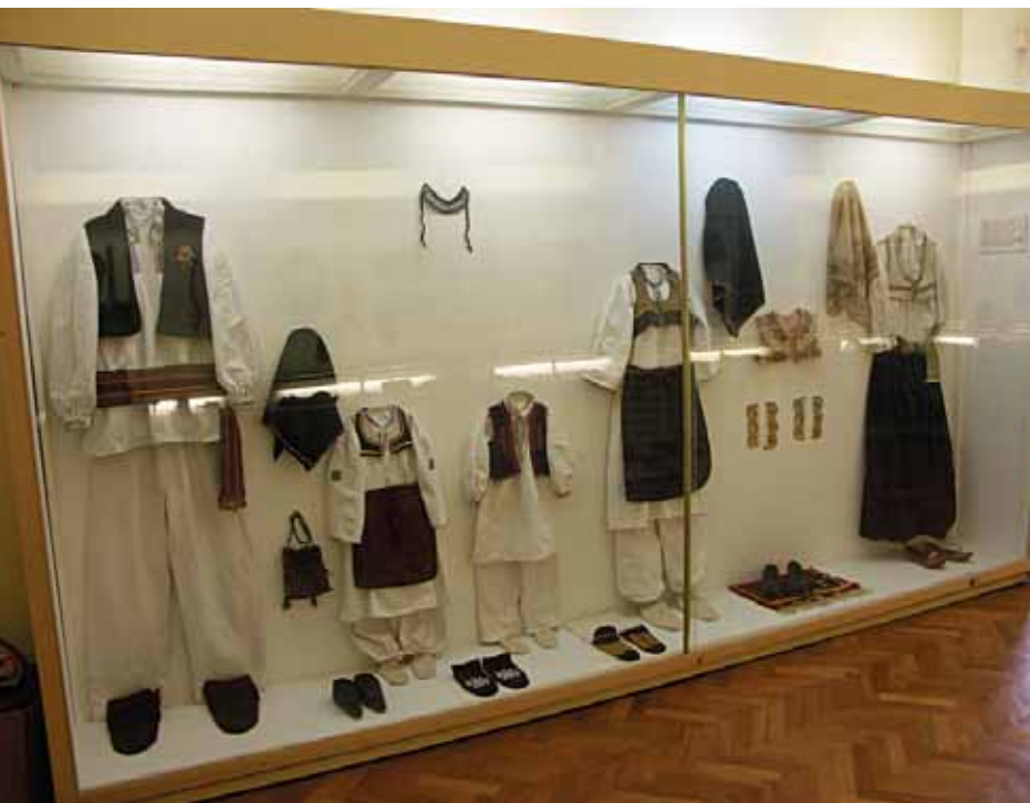
Muška i ženska narodna nošnja iz Kraljeve Sutjeske

Predmeti ove zbirke sakupljani su nakon Prvog i Drugog svjetskog rata i dijelom sedamdesetih godina prošlog stoljeća. Postav je uređen 1975., a manje preinake učinjene su 2000. godine.