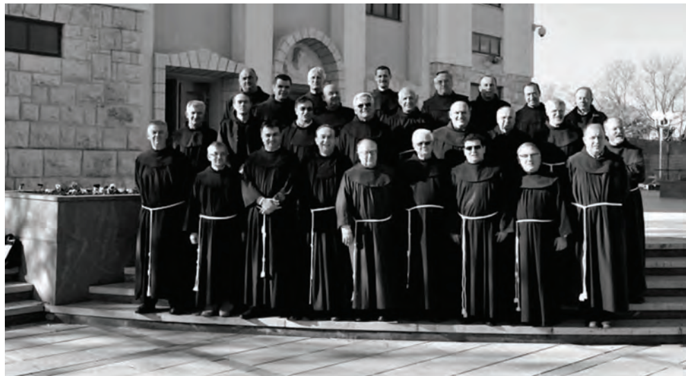
Susret uprava šest Južno-slavenskih franjevačkih provincija